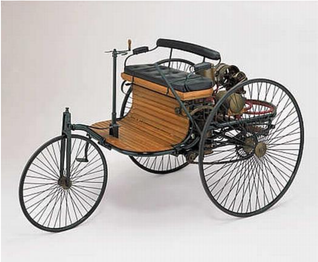
Benz Patent Motor Car

Met deze patenten op zak begon Karl aan de ontwikkeling van een "gemotoriseerd voertuig" dat uiteindelijk in 1885 werd gerealiseerd, in 1886 gepatenteerd en de naam Benz Patent Motor Wagen mee kreeg. Omdat er geen sprake was van een experimenteel voertuig, maar een voertuig dat in grotere aantallen werd geproduceerd en voor het publiek te koop was, wordt de Benz Patent Motor Wagen als de allereerste automobiel beschouwd. Een reconstructie van dit voertuig (er bestaat geen origineel meer) is in het Louwman Museum te bewonderen.